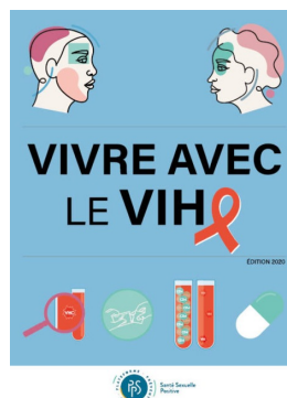
Brochure d'accompagnement La plateforme belge PREVENTION SIDA a conçu cette brochure pour guider