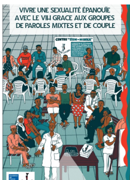
Capitalisation : les groupes de paroles La SWAA LITTORAL