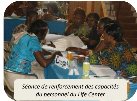
Séance de renforcement des capacités du personnel du Life Center

Ce type de service étant une innovation dans le paysage de la prise en charge des personnes infectées en milieu communautaire, il était capital que le personnel dédié soit formé de manière adéquate avant sa prise de fonction. Ces sessions portaient à la fois sur la conduite des activités classiques de prise en charge psychosociale, et sur les spécificités de l'accompagnement des travailleuses du sexe.