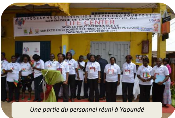
Une partie du personnel réuni à Yaoundé