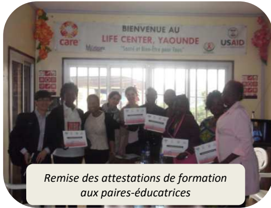
Remise des attestations de formation aux paires-éducatrices

Les paires-éducateurs et paires-éducatrices (PE) sont chargés des activités de sensibilisation au sein de leur communauté (à travers des causeries, des séances d'information et des visites sur les sites de prostitution), et de l'orientation des bénéficiaires vers les Life Center.