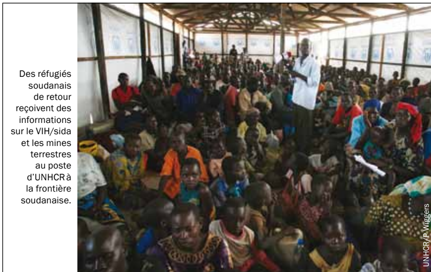
Des réfugiés soudanais de retour reçoivent des informations sur le VIH/sida et les mines terrestres au poste d'UNHCR à la frontière soudanaise.

au Sud-Soudan, bien que quelques études aient été menées pour essayer de déterminer l'étendue de l'épidémie dans la région. L'une de ces études a indiqué un taux de prévalence du VIH se situant entre 2 et 4 % de la population, tandis qu'une autre, menée dans des cliniques anténatales en 1996, suggérait un taux de 5 %. Parmi les différentes tribus, différents noms sont donnés au VIH/sida, ce qui rend plus difficile la collecte de données. Malgré ce manque de données précises, l'environnement post-conflit à haut risque, auquel s'ajoute le manque d'infrastructures, met en évidence à la fois le besoin de mettre en œuvre des politiques de prévention et d'atténuation du VIH, et les difficultés de cette mise en œuvre.