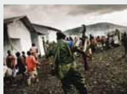
Camp pour personnes déplacées de Kibati, en RDC

Les personnes déplacées par les conflits (et de retour chez elles) entrent souvent en contact avec des individus transportant des armes sous diverses formes. De même, les individus armés sont eux-mêmes souvent mobiles, quelle que soit leur relation aux conflits ou à leurs conséquences. En particulier, dans les situations de déplacement forcé, les membres des forces de sécurité peuvent devenir les agents d'un changement favorable vis-à-vis du VIH et du sida – ou une partie du problème.