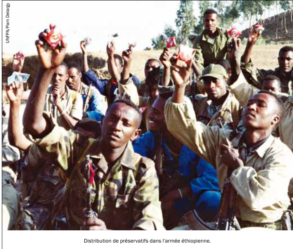
Distribution de préservatifs dans l'armée éthiopienne.